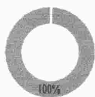
Cumplimiento Gestión EPP